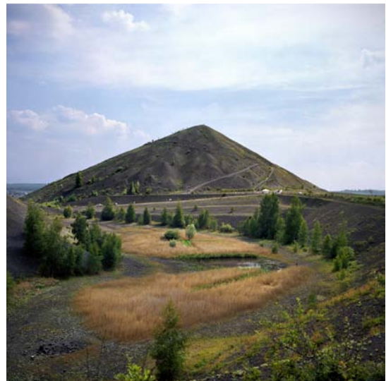
Terril du 11/19, Loos-en-Gohelle - Juin 2010