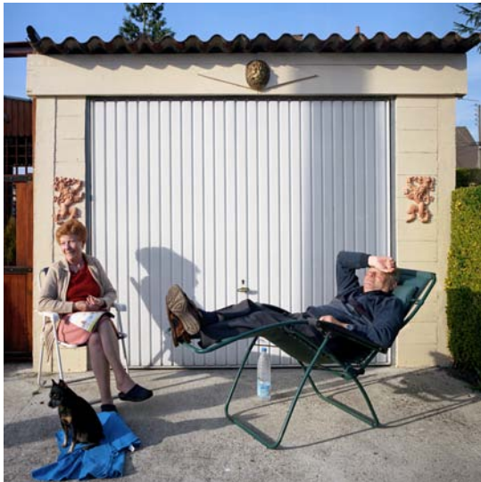
Bain de soleil, Oignies - Avril 2009