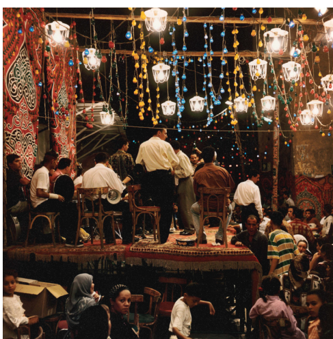
Mariage dans la Gamaleya, Le Caire, 1998.