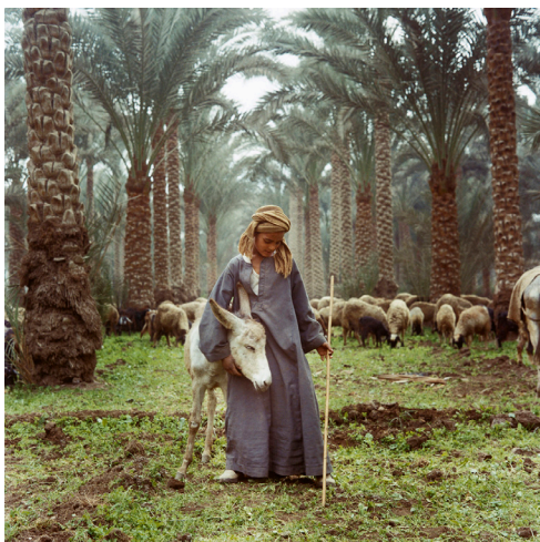
Berger à Saqhara, 1996.